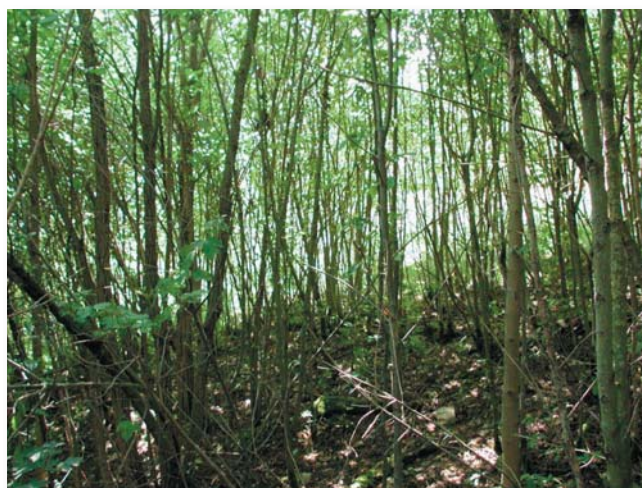
Figure 5: View down the slope in survey area 13 in 2004

By 2004 the number of woody plants had increased to 18 species, corresponding to a 28.6 % growth. The number of species in the tree layer had increased by four species to six and in the shrub cover by ten species to twelve. The most abundant species in the tree layer were Salix caprea (goat willow), Acer pseudoplatanus (sycamore) and Picea abies