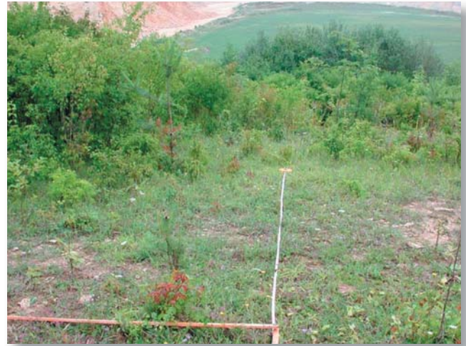
Figure 2: View down the slope from survey area 6 in 2004

Bild 1: Blick über den offenen Bereich im oberen Hangviertel der Böschung vom Transekt aus im Jahr 2004