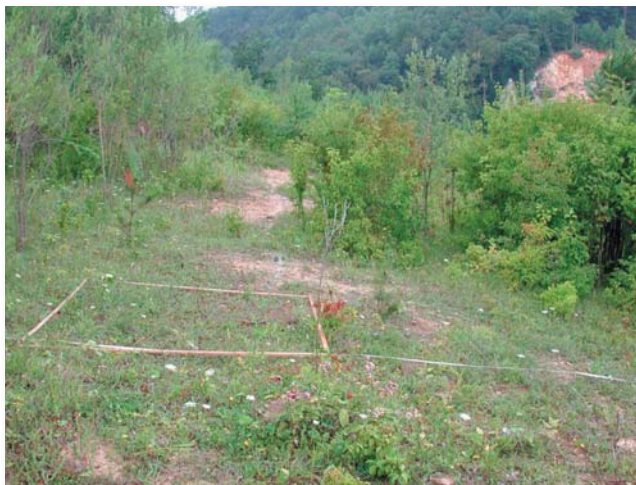
Figure 1: View of the open area on the upper inclined quarter of the slope of the transect in 2004

The tree and shrub layers are defined as follows on the basis of their respective heights: tree layer: > 5 m, shrub layer: 0.2 to 5 m. In 1992 only on survey area 1 directly at the edge of the woodland on the upper edge of the slope was there a degree of coverage by the tree layer of 70 % (Fig. 3). The coverage ratios close to the edge of the woodland have remained the same up to 2004. In 1992 there were no woody plants with a height greater than 5 m on the rest of the survey areas, but the picture had changed significantly by the investigation in 2004. The woodland covering had spread on the slope so that survey area 2 had a 10 % coverage. There were no tree layers on the level areas of slope